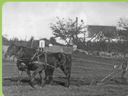
Den gamle Kolind Kirke fra før 1918