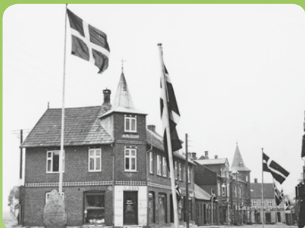
Torvet i Kolind omkring 1935