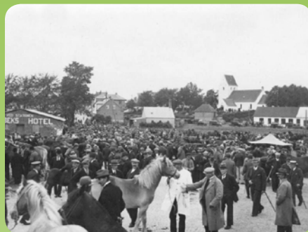
Markedspladsen ved Byhallen