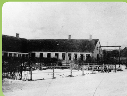
Kolinds gamle skole på Nødagervej

Senere ændres vandretningen, så vandet løb mod Grenå. Her udgravedes også en dal, som havde forbindelse til havet. Da isen var bortsmeltet lå, der derfor en fjord tilbage. Den har fået navnet "Kolindsund".