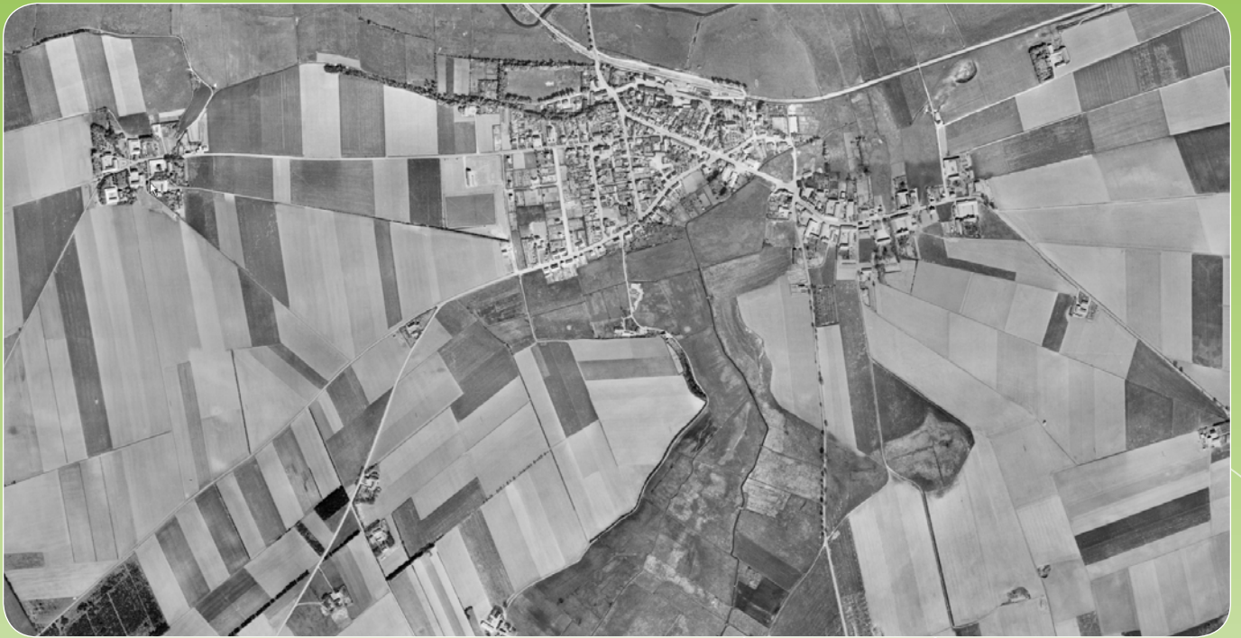
Luftfoto af Kolind. Det øverste er fra 1954 og det nederste er fra 2013