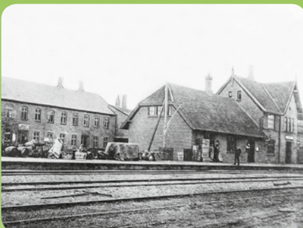
Kolind Station ca. 1920