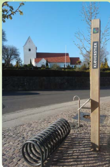
Det er her de 4 ruter starter.

Husk at passe på naturen, efterlad ikke affald, hunde skal altid holdes i snor og efterladenskaber skal opsamles!!