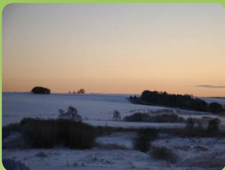
Udsigt over Kolind enge