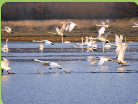
Sangsvaner i Kolind Engso