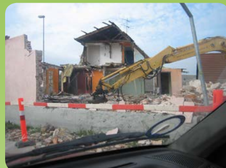
Det gamle cafeteria og diskoteque rives ned

gennem Kulkanalen havde forbindelse til kanalerne i Sundet. Her i stationsområdet har de første ”Kolinesere” (stenalderfolkene) boet. Her har man fundet store køkkenmøddinger.